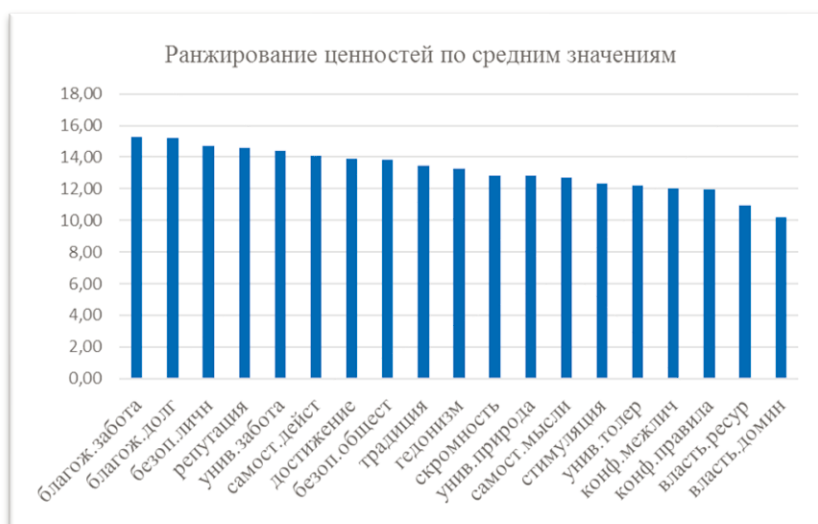
Рис. 2. Диаграмма ранжирования индивидуальных ценностей молодежи. Данные 2024 года

Для сравнения аналогичные данные, полученные в 2016 году с применением другой методики Шварца (Профиль личности, адаптация В. Н. Карандашева, 2004) представлены на диаграмме (рис. 3). Как показано ниже, при схожести в целом структур индивидуальных ценностей молодежи, полученных в 2016 и 2024 году (ср. рис. 2 и 3), в них произошли важные изменения.